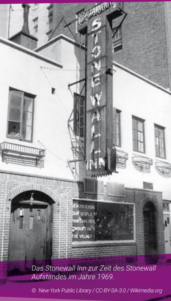
Das Stonewall Inn zur Zeit des Stonewall Aufstandes im Jahre 1969.