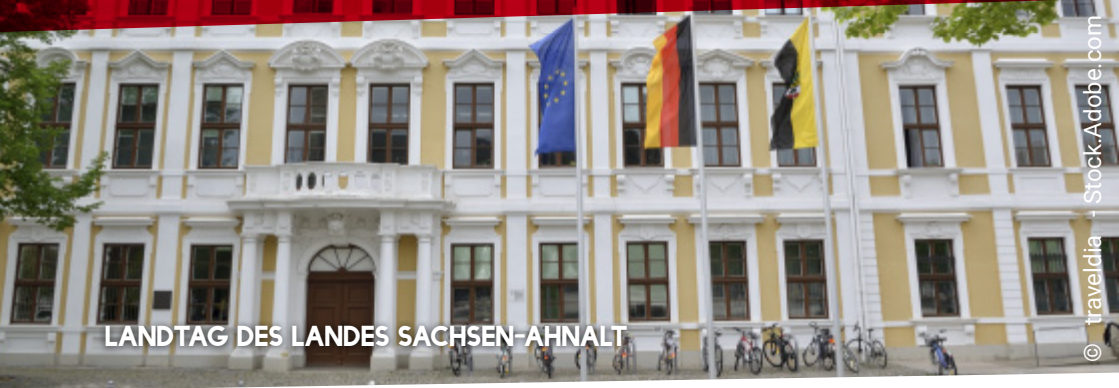
LANDTAG DES LANDES SACHSEN-AHNALT